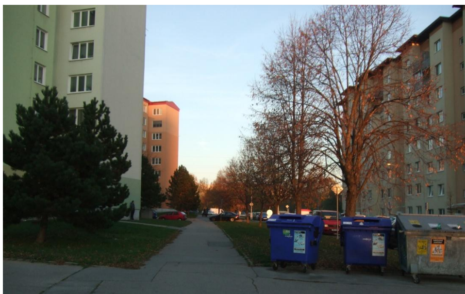
Dominantní lipová alej do budoucna vhodná k doplnění