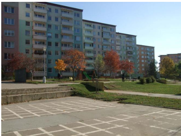
Malé a střední stromy v prostoru velkého dvora