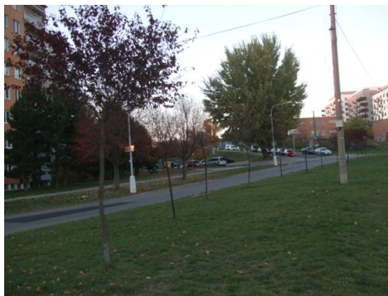
Nevhodná výsadba malokorunných stromů u parkoviště