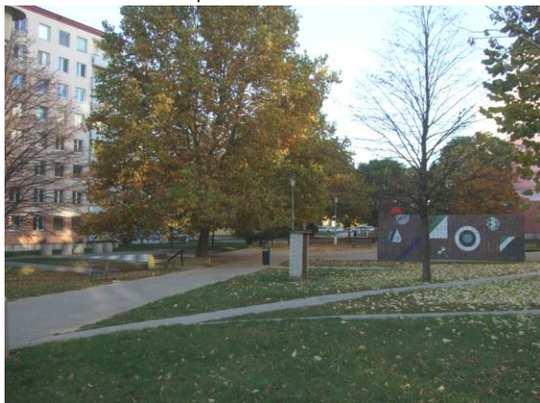
Pobytový dvůr se vzrostlými platany a výtvarným objektem