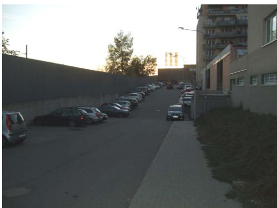
Nepříjemný a nehodnotný veřejný prostor u nové výstavby