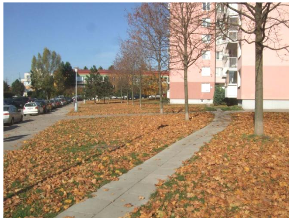
Javorová alej s legalizovaným důležitým prošlapem