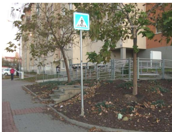
Nevhodně řešený vstupní prostor nového bytového domu