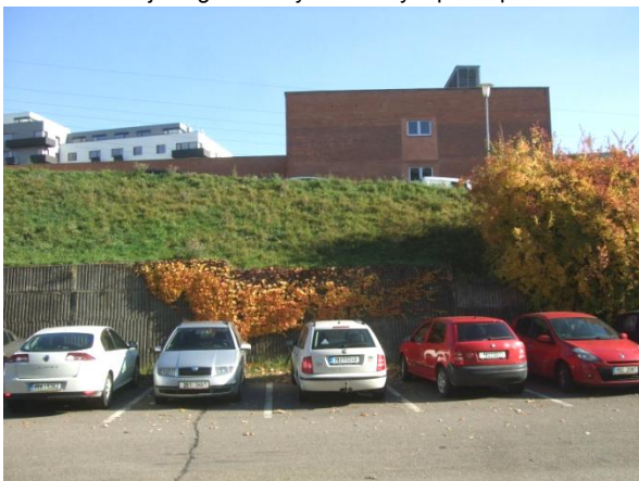
Opěrná betonová zeď vhodně doplněná popínavkou