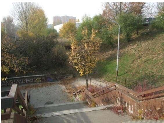
Navazující prostor zastávky MHD Novolišeňská