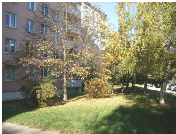
Lípa nevhodně vysazená velmi blízko fasády